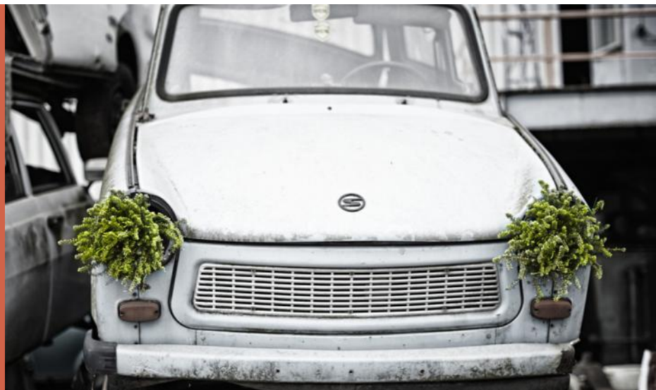
▲ Grüner wird 's nicht: Erica darleyensis als Scheinwerfer.

▲ Heidepflanzen sind robust und fast jeder Situation gewachsen.