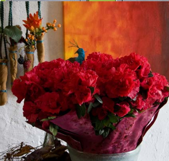
◀ Herbstarrangement: Die rot blühende Azalee im Gefäß aus gefroretem Glas wird von Beeren, Zweigen und Blättern begleitet. ▶