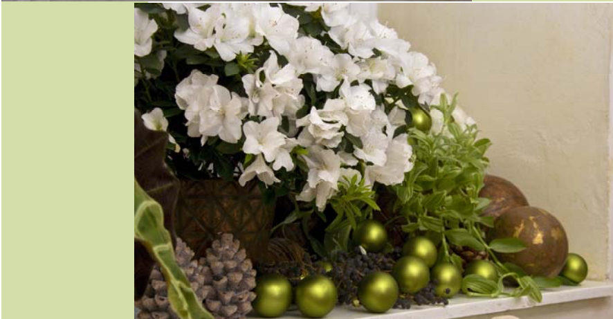
◀ ▲ Azaleen lassen sich gut mit immergrünen Pflanzen kombinieren. Die Weihnachtskugeln und Zapfen lassen Weihnachtsstimmung aufkommen.