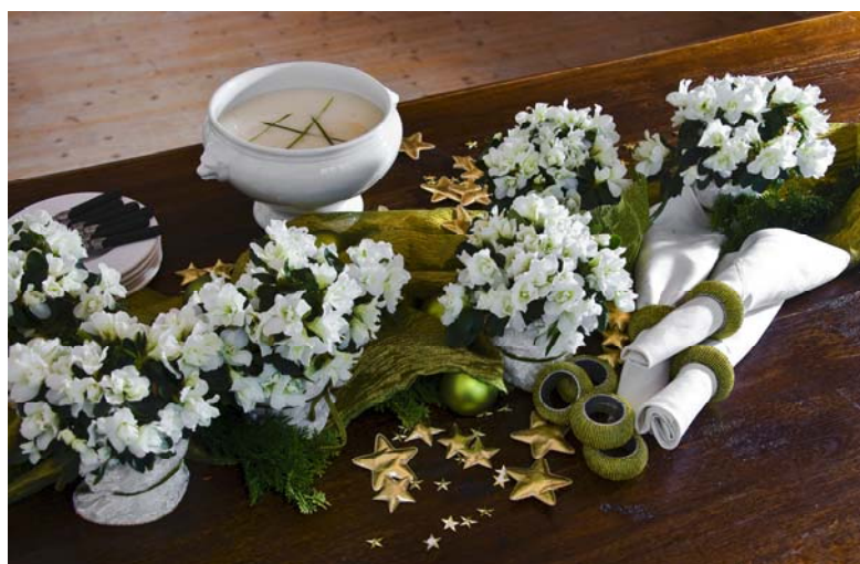
▲ Ein Weihnachtstraum in Grün und Weiß: Die weißen Mini-Azaleen laden zum festlichen Abendessen ein.

Prächtige Blüten, leuchtende Farben – das sind die Markenzeichen von Azaleen. Kaum eine andere Pflanze bringt den Winter so zum Strahlen wie die kleinen Verwandten der Rhododendren. Zur Weihnachtszeit eignen sich Azaleen für winterliche Dekorationen jeder Art. Ob auf der Fensterbank, als Tisch- oder Raumschmuck – Azaleen bringen Leben in jeden Wohnraum. Kombiniert man sie mit Weihnachtskugeln, Zapfen