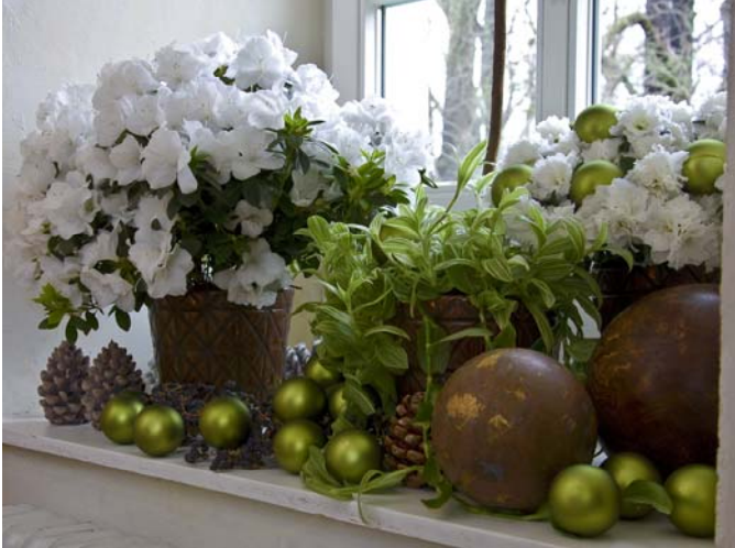
◀ Ein winterliches Azaleen-Arrangement auf der Fensterbank in Weiß, Grün- und Brauntönen gehalten.