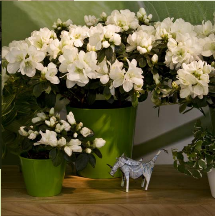
▲ Frisch und fröhlich: Ein Arrangement in Weiß und Grün. Witzig dazu: Die Tierfigur aus Metall. ▶