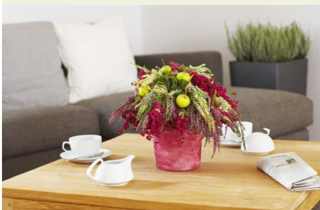
Heide mal anders: Ein bunter Strauß aus Eriken und Callunen. ▼