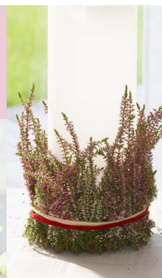
▲ Hält über Wochen: Ein Windlicht mit rosafarbenen Callunen dekoriert.