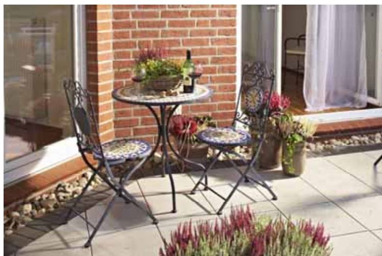
▲ Ein gemütlicher Spätsommerabend auf der Terrasse: Die Heidepflanzen strahlen mit der Abendsonne um die Wette!

Heidepflanzen sorgen im Spätsommer und Herbst im Eingangsbereich mit ihren fröhlichen Farben dafür, dass sich Gäste jederzeit willkommen fühlen. Dabei kann der Türbereich ganz individuell gestaltet werden. Ein Kranz an der Tür oder eine schöne Kübelbepflanzung lässt den Eingangsbereich freundlich und belebt wirken. Hier kann mit den verschiedenen Arten von Heidepflanzen gut Ton-in-Ton gearbeitet werden. Ob Sie sich dabei für